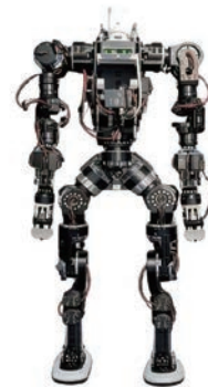
輕量化金屬結構件